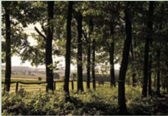
Mitten im Schönburger Land liegt der Waldfriedhof eingefriedet zwischen Feldern und Wiesen

Neben stehend finden Sie die Gebührenordnung des Waldfriedhofes Schönburger Land. Die Auswahl einer Grabstelle erfolgt bei einem persönlichen Termin vor Ort. Bitten nehmen Sie hierzu direkten Kontakt mit uns auf und vereinbaren einen Termin im Waldfriedhof.