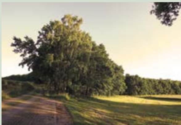
Sommerlicher Blick auf den Eingang zum Waldfriedhof Schönburger Land

Die Beisetzungszeremonie im Waldfriedhof Schönburger Land kann von Ihnen frei gestaltet werden. Die Beerdigung wird in der Regel von einem Bestattungsinstitut Ihrer Wahl betreut. In der Mitte des Waldfriedhofes befindet sich auf einer kleinen Lichtung ein Andachtsplatz mit Sitzgelegenheiten, einem Altar und einem Kreuz. Die Trauerfeier kann entweder dort oder an der Grabstätte selbst abgehalten werden.