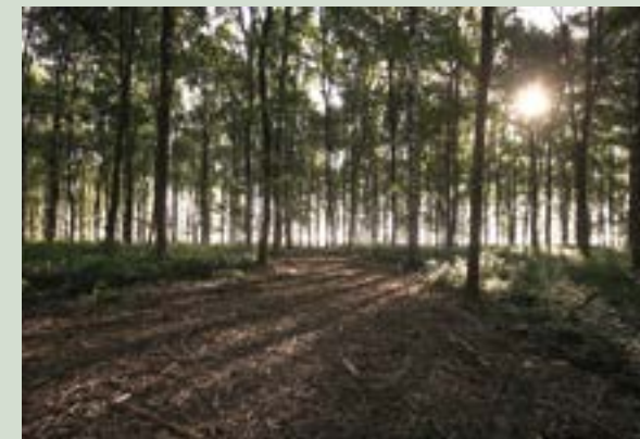
Lichtdurchflutete Eichen und Birken bringen wohltuende Ruhe in den Waldfriedhof

In der Stunde der Trauer oder auch bei der vorausschauenden Wahl einer Grabstelle ist vielen Menschen eine persönliche und vertraute Beratung besonders wichtig. Als einer der wenigen familiengeführten Waldfriedhöfe in Deutschland, bieten wir diese persönliche und umfassende Betreuung.