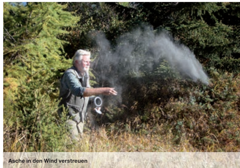
Asche in den Wind verstreuen