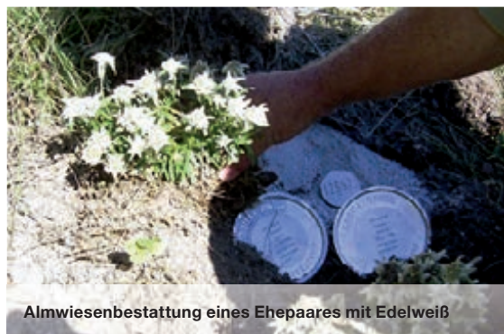
Almwiesenbestattung eines Ehepaares mit Edelweiß