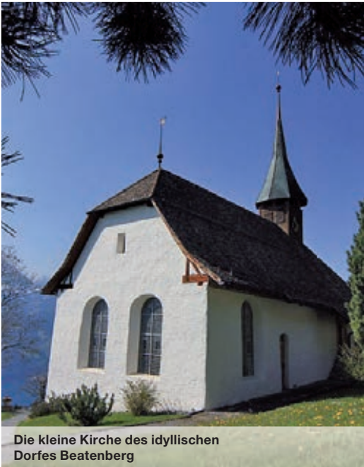
Die kleine Kirche des idyllischen Dorfes Beatenberg

Nach der Abwicklung des Sterbefalls durch den regionalen Bestatter wird die Urne vom deutschen Krematorium direkt an die