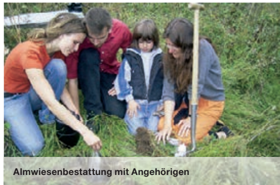
Almwiesenbestattung mit Angehörigen